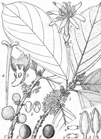
Pl. 1. — Neorosea raynalianorum N. Hallé ( J. et A. Raynal 12230 ) : 1, rameau florifère \times 0,75 ; 2, fleur de 17 mm de diam.; 3 a, étamine dans le bouton; 3 b, étamine après déhiscence, longue de 2,9 m ; 4, style long de 13 mm; 5, coupe du calice et du disque; 6, placenta floral recto et verso; 7, rameau fructifère; 8, graine de 6 \times 5,5 mm.